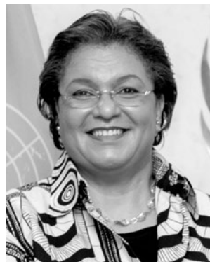
Hannah S. Tetteh

Am 10. Dezember 2018 wurde die Ghanaerin Hannah S. Tetteh zur Sonderbeauftragten des Generalsekretärs für die Afrikanische Union sowie zur Leiterin des Büros der Vereinten Nationen bei