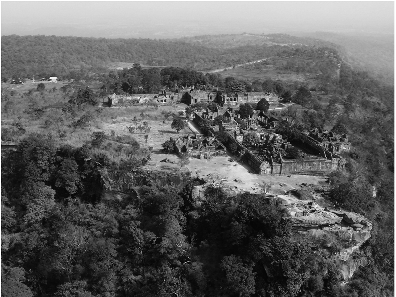
Tempelanlage Preah Vihear