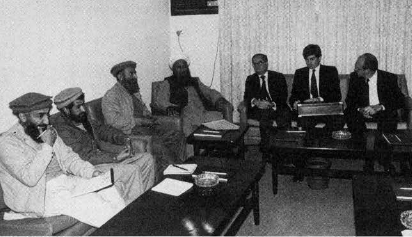
Stationen einer Vermittlungsbemühung: UN-Untergeneralsekretär Diego Cordovez in Peshawar (obiges Bild, mit Younis Khalis und weiteren Vertretern der Mudschahedin am 30. Januar 1988) und in Kabul (Bild gegenüber, mit Präsident Najibullah am 24. Januar).

kreisen, sondern auch unter Afghanen selbst spekuliert. Dies generell unter dem Eindruck der politischen Dauerkrise einerseits und der faktischen Aufteilung des Landes in entwicklungspolitische Interessensphären — der Norden erschien dem sowjetischen beziehungsweise Comecon-Einflußbereich und der Süden den Interessen kapitalistischer Länder zugeordnet — andererseits. Zu fragen ist allerdings, wie lange die kommunistische Kontrolle dieser Regionen gegen die Aktivitäten der auch dort erfolgreich operierenden Mudschahedin, insbesondere der Jamiate Islami des Burhanuddin Rabbani, die von dem befreiten Süden laufend Verstärkung erhielten, gehalten werden könnten.