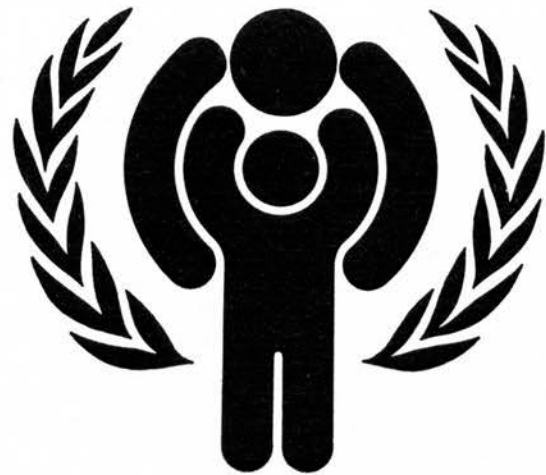
Zum Internationalen Jahr des Kindes erklärte die 31. Generalversammlung das Jahr 1979. Das von dem dänischen Künstler Erik Jerichau gestaltete Sinnbild veranschaulicht, daß die Kinder aller Länder den Schutz und die Hilfe der Erwachsenenwelt benötigen. Die Bedeutung, die die Weltorganisation Sozialfragen beimißt, zeigt sich auch darin, daß das Jahr 1981 zum Internationalen Jahr der Behinderten erklärt wurde.

Die Gründe, warum die Sowjetunion sogar in Abweichung von den Regeln der russischen Sprache nur bei der Bezeichnung Bundesrepublik Deutschland den Genetivus partitivus